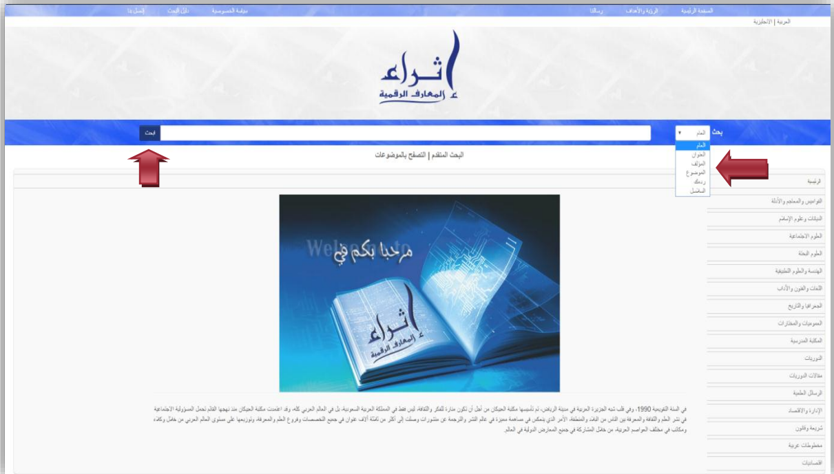
الشكل رقم (٧)

يتم البحث داخل الخانة الموضحة بالشكل رقم (٧) من خلال إدخال الكلمة المفتاحية أو أي موضوع تريد البحث عنه بشكل عام، ولتضييق نتائج البحث يمكنك الضغط على القائمة المنسدلة التي على يمين خانة البحث، وكما هو موضح بالشكل يوجد عدة خيارات للبحث (بالعنوان، المؤلف، الموضوع، ردمك أو الترقيم الدولي الموحد للوعاء، اسم السلسلة)، وبعد كتابة الخيار المقصود يتم الضغط على زر "البحث".